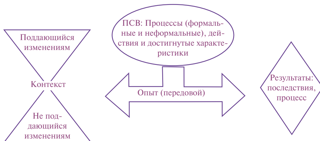
Рисунок 2. Концептуальная рамка

Поэтому программы снижения вреда с наиболее передовым опытом — это те, которые способны достигать хороших результатов в неблагоприятной среде, при наличии трудностей с финансированием, способны улучшать те контекстуальные переменные, которые поддаются изменению в то же время, повышая эффективность, межсекторное сотрудничество и стабильность (рисунок 2).